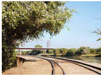
Vías del Paseo Fluvial.