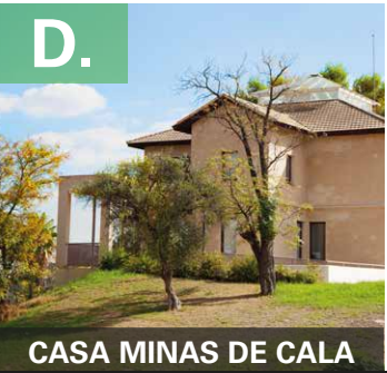
CASA MINAS DE CALA