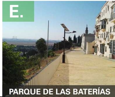
PARQUE DE LAS BATERÍAS