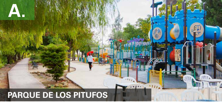
PARQUE DE LOS PITUFOS