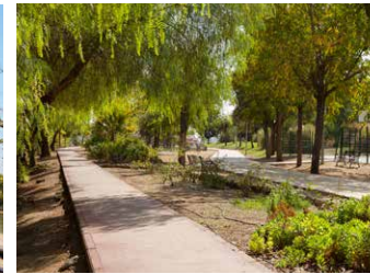
Sendero del Parque de los Pitufos.