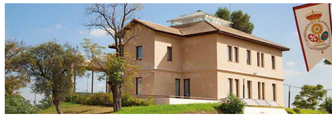
Panorámica de Casa Minas de Cala.