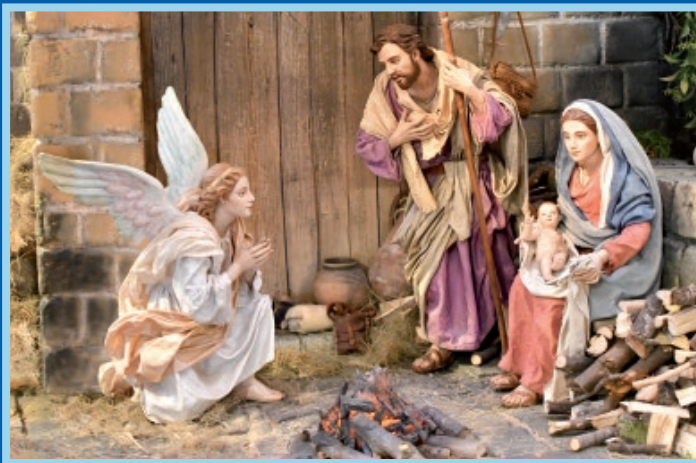
Detalle del Belén Artístico de Silvio Torilo 2023/24